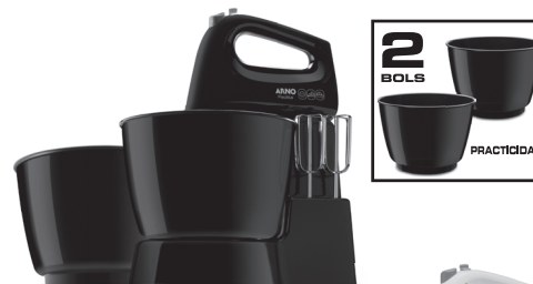
BATIDORA FACILITA (cor negra - con dos bols de 4L)