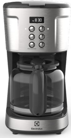
Fotos e desenhos ilustrativos CAFETEIRA_ECM30_PORT_REV00