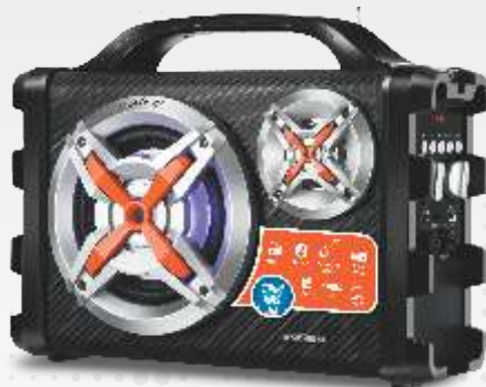
MULTI CONNECT - MCO-09