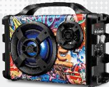
MULTI CONNECT - MCO-12