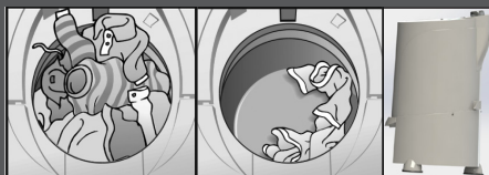
Excesso de Roupa