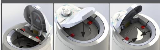
5 - Abaixe a tampa de proteção

Importante: A abertura da tampa externa aciona o freio da centrífuga, aguarde o cesto parar completamente para abrir a tampa de proteção.