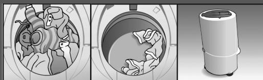
Excesso de Roupas