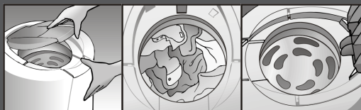
1 - Puxe a trava da tampa