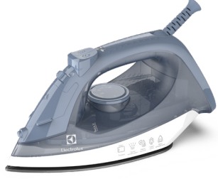
Fotos e desenhos ilustrativos FERRO PASSAR_ ES110 ES111 PORT_REV00