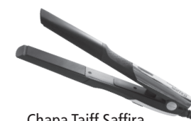
Chapa Taiff Saffira

Este produto não é brinquedo, mantenha-o fora do alcance de crianças.