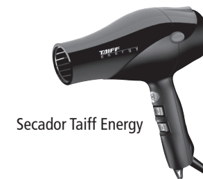
Secador Taiff Energy