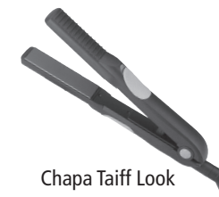
Chapa Taiff Look