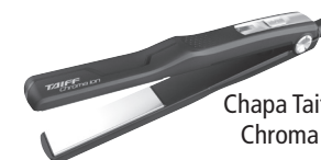
Chapa Taiff Chroma