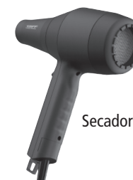
Secador Taiff Turbo 6000