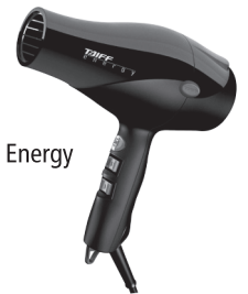
Secador Taiff Energy