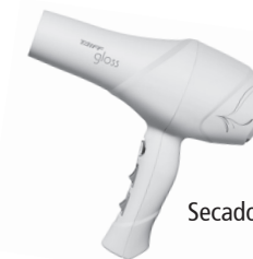
Secador Taiff Gloss

Este produto não é brinquedo, mantenha-o fora do alcance de crianças.