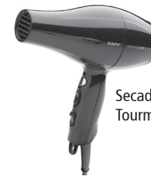
Secador Taiff Tourmaline Ion Cerâmica