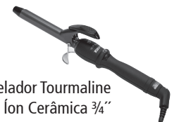
Modelador Tourmaline Ion Cerâmica 3/4"