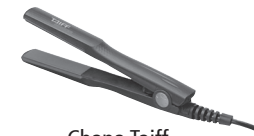
Chapa Taiff Super Mini