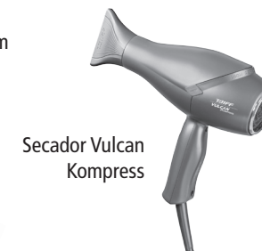
Secador Vulcan Kompres