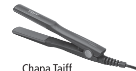
Chapa Taiff Super Mini