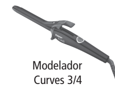
Modelador Curves 3/4

Este produto não é brinquedo, mantenha-o fora do alcance de crianças.