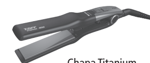
Chapa Titanium 450 Colors